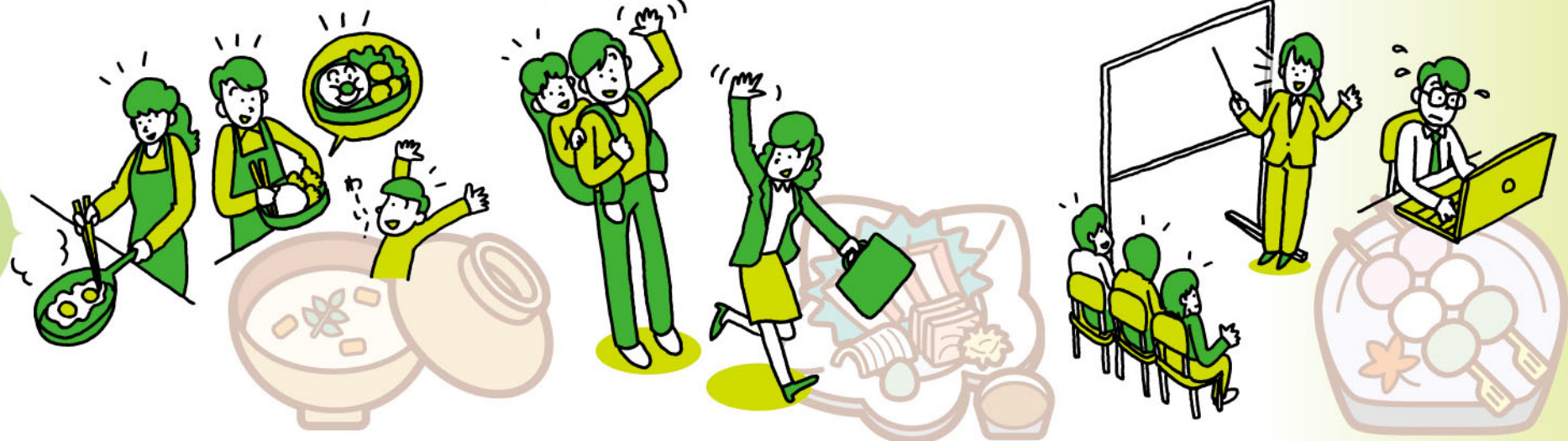
忙しい朝はお互いに協力