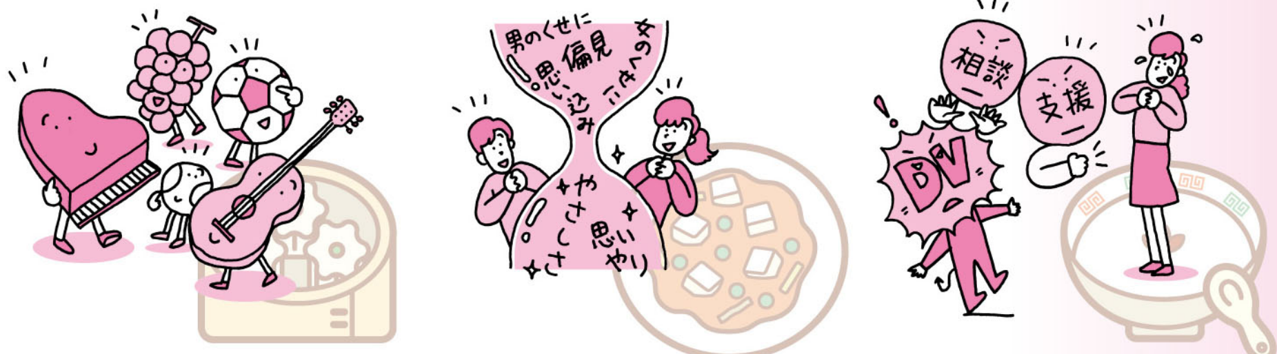
地域活動で自分らしさを発揮