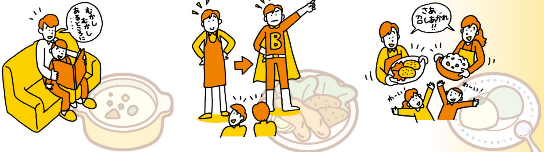
男性も楽しく積極的に育児(イクメン)