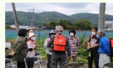
↑地区ごとの振り返りを行いました

自主防災会で購入した防災リュックを背負って避難訓練をしていただきました。これを機に、防災リュックに何をに入れておくか、それぞれ考えてみてください。