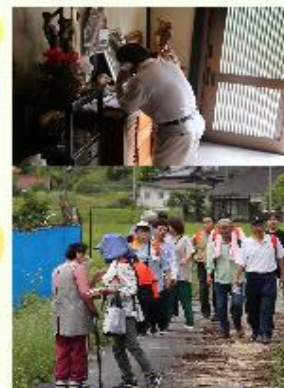
←避難を呼びかける津村防災会長

深瀬地区では、警戒レベル4「避難指示」が発表されたら、防災会長から各地区(常会)の防災会長へ連絡し、地域の皆さんへ避難の呼びかけを行います。