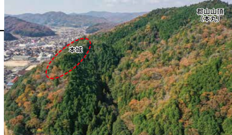
郡山山頂と本城(ドローン撮影)