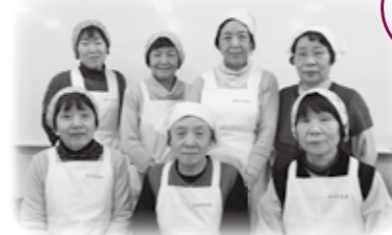
安芸高田市食生活改善推進協議会 吉田支部