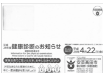
「健康診断のお知らせ」封筒

4月15日(金) 18:30~20:30 4月29日(金・祝) 13:30~15:30