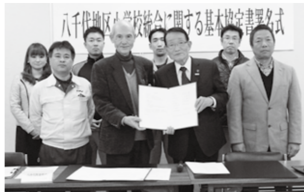
八千代地区小学校統合に関する基本協定書署名式