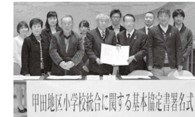
甲田地区小学校統合に関する基本協定書署名式

●基本協定書署名までの経緯 平成23年1月に策定した「学校規模適正化推進計画」に基づき、八千代地区・甲田地区においては統合準備委員会を設置し、統合条件などを協議してきました。このたび主だった項目についての協議が整ったため、市長・各学校・各保育所・幼稚園保護者会・地域振興会のそれぞれの会長が本協定書に署名しました。 今後、相互連携を図りながら、統合期日までに審議未了の協議事項を調整してまいります。 ●八千代地区基本合意事項 【統合年月日】平成30年4月1日 【統合校の名称】安芸高田市立八千代小学校 【統合校の位置】八千代町上根10033番地1（現根野小学校） ●甲田地区基本合意事項 【統合年月日】平成30年4月1日 【統合校の名称】安芸高田市立甲田小学校 【統合校の位置】甲田町上甲立433番地（現甲立小学校）